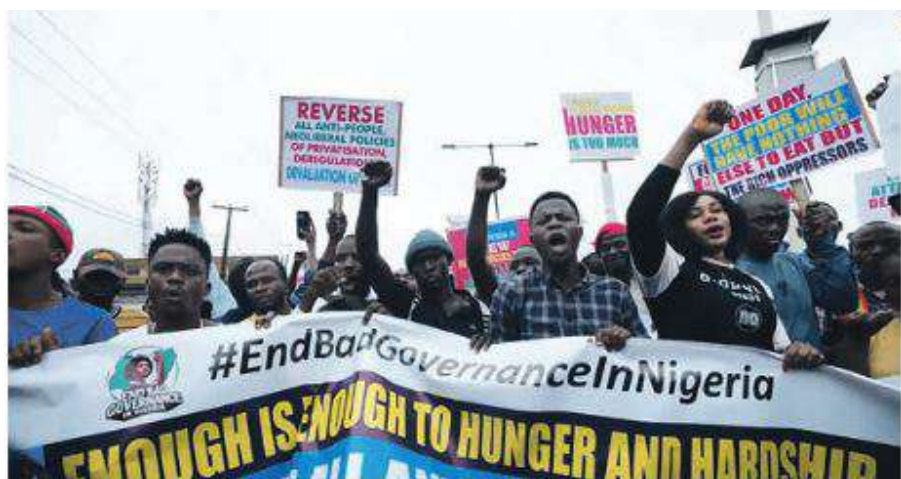
Manifestation au Nigeria, le 2 août

taires, de nombreux Nigériens ne peuvent plus s'acheter de la viande, des œufs, du lait ou des pommes de terre. Aux cris de « On a faim », les manifestants revendiquent le retour des subventions, la fin de la misère et de la corruption.