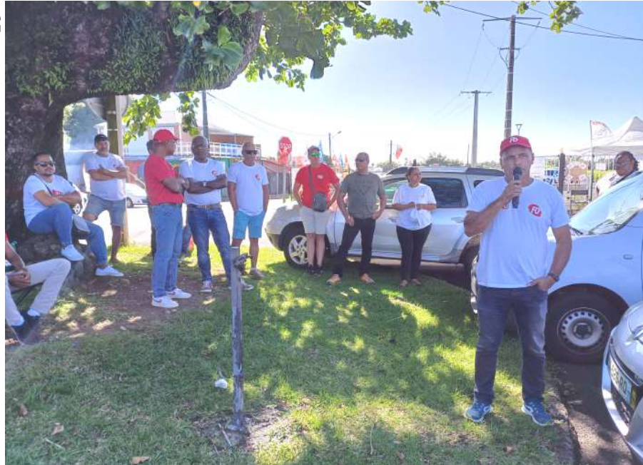
Grève de novembre 2023 à Bras Panon

Que les voleurs et leurs complices rendent gorge. Ce n'est pas aux salariés d'Estival d'éponger les dettes de l'entreprise creusés par d'autres !