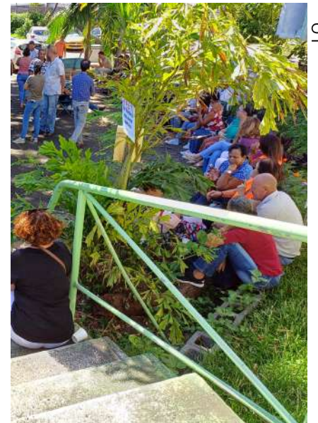
Salariés en grève en février

Mais face aux mauvais coups qui vont arriver, les travailleurs de la Chambre doivent se préparer à entrer à nouveau en bagarre.