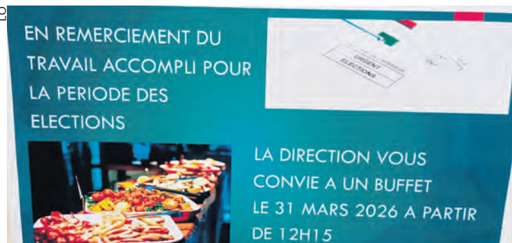
Après la distribution des plis électoraux, La Poste remercie les travailleurs... par de nouvelles suppressions d'emplois.