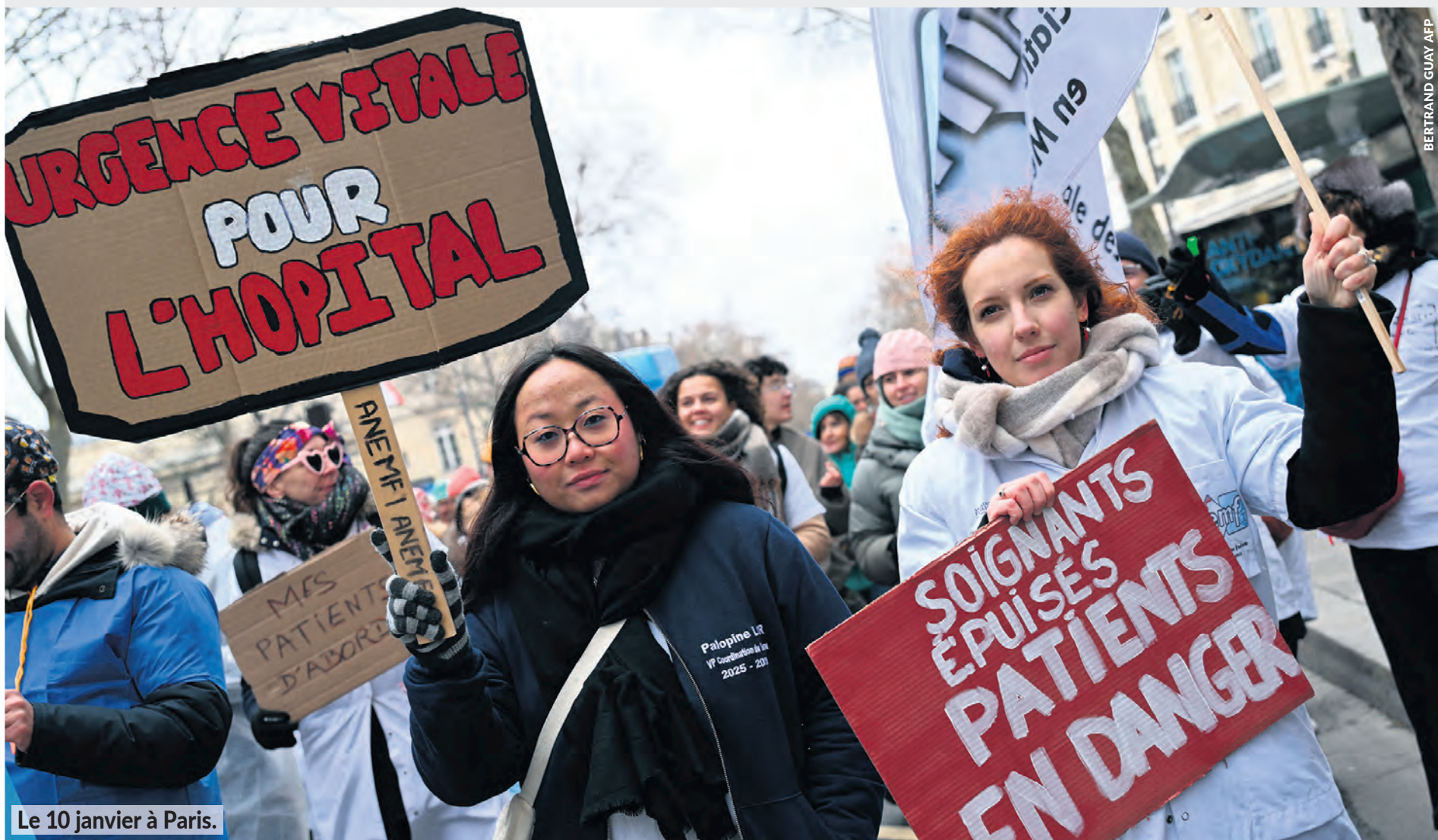
Le 10 janvier à Paris.