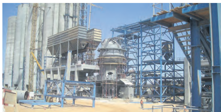
La cimenterie Lafarge de Jalabiya.