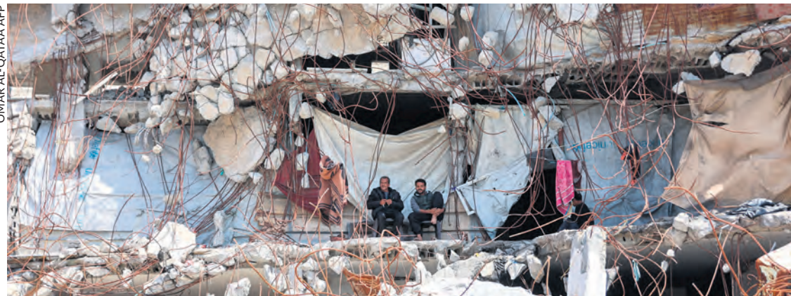
Dans le camp de Jabalia, à Gaza, le 13 avril 2026.