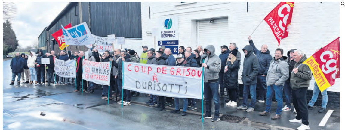
Les travailleurs de Durisotti mobilisés, le 26 mars.

À la SPAC, qui appartient au même groupe, sans travail dans les ateliers, les salariés ont démissionné les uns après les autres,