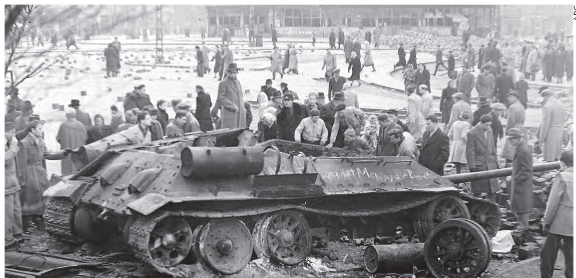
À Budapest, en 1956, char russe détruit par les insurgés.