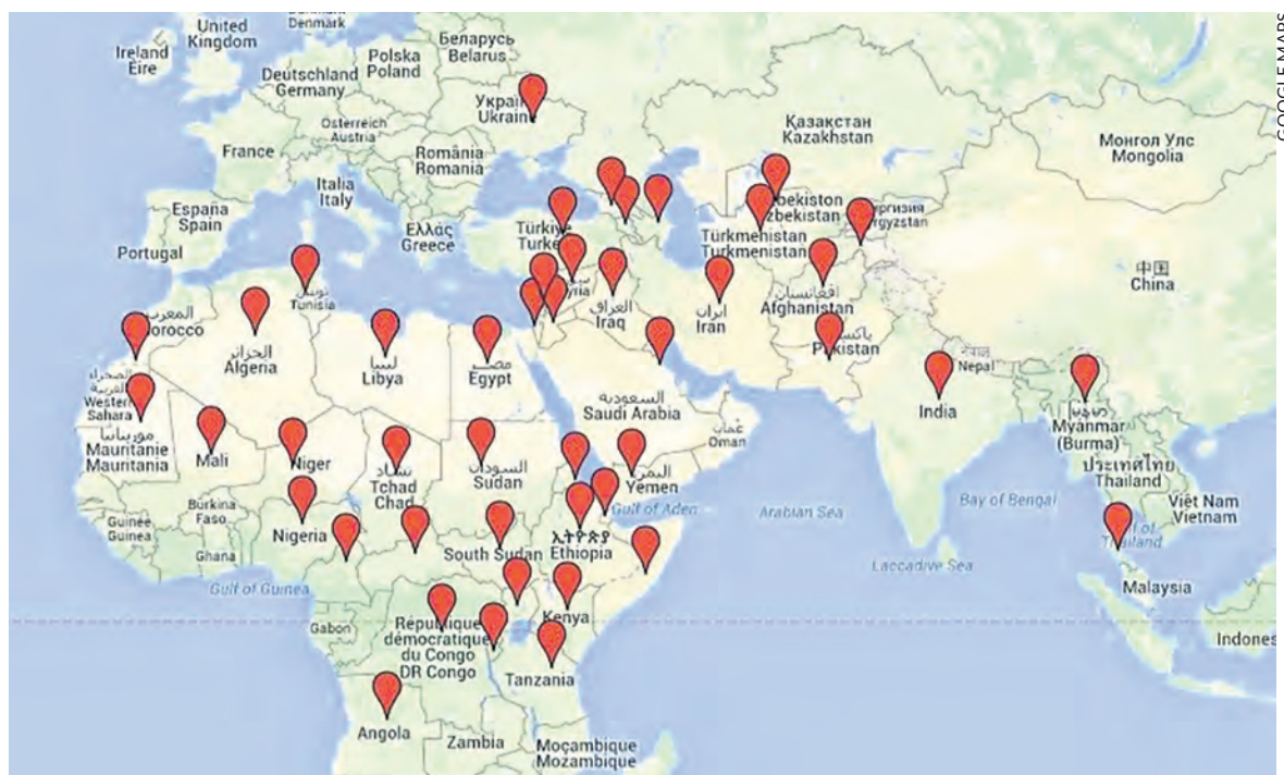
La carte des destinations déconseillées par le ministère français des Affaires étrangères.