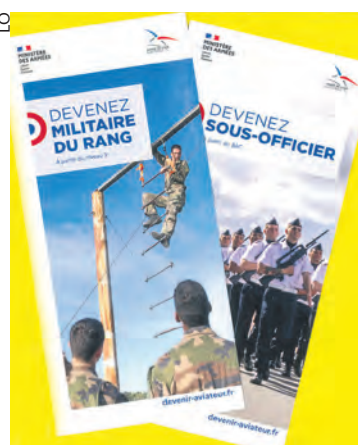
Publicité pour l'armée dans les mairies.

Au cours de leur première réunion, les conseils municipaux élus les 15 et 22 mars ont élu les maires, les adjoints et ont désigné les « correspondants défense ».