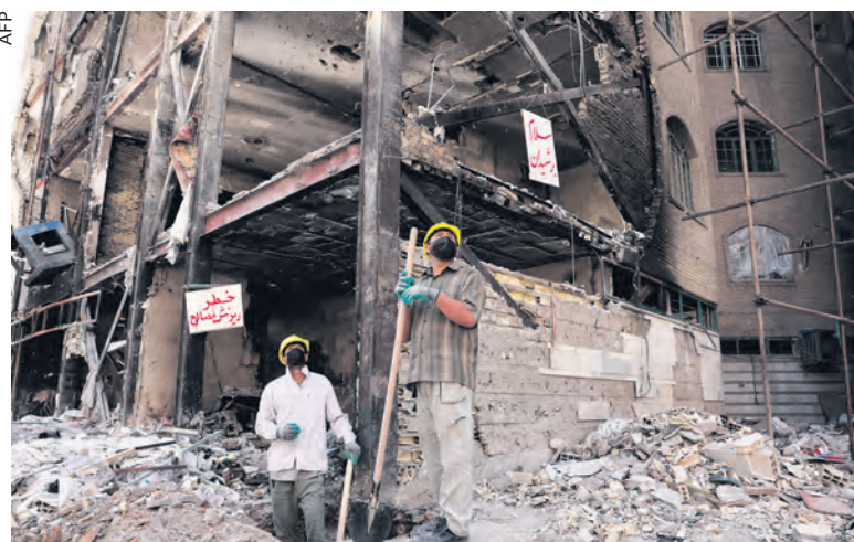
Après un bombardement, au sud de Téhéran.