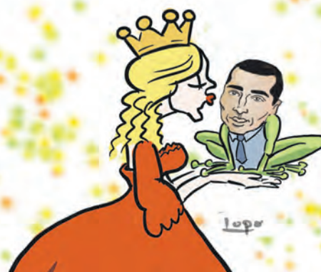
Un baiser transformera-t-il le crapaud en président ?