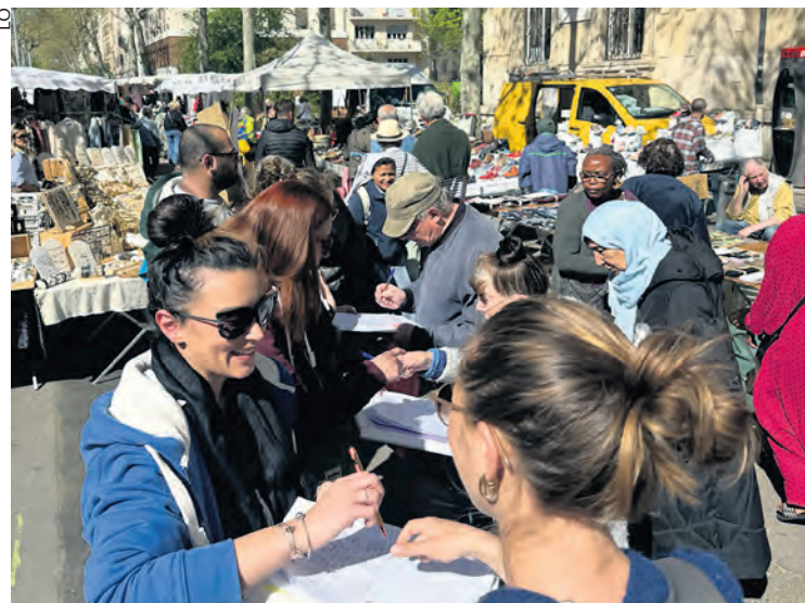
Les grévistes sur le marché de la Croix-Rousse, le 7 avril.