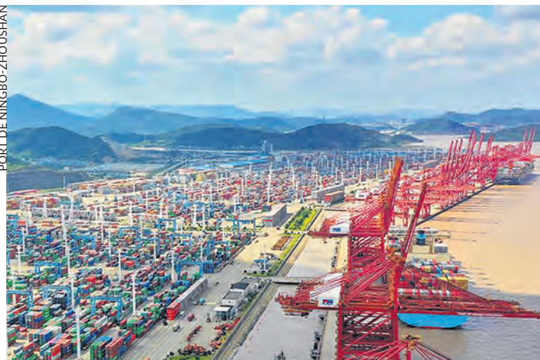
Le port chinois de Ningbo Zhoushan.