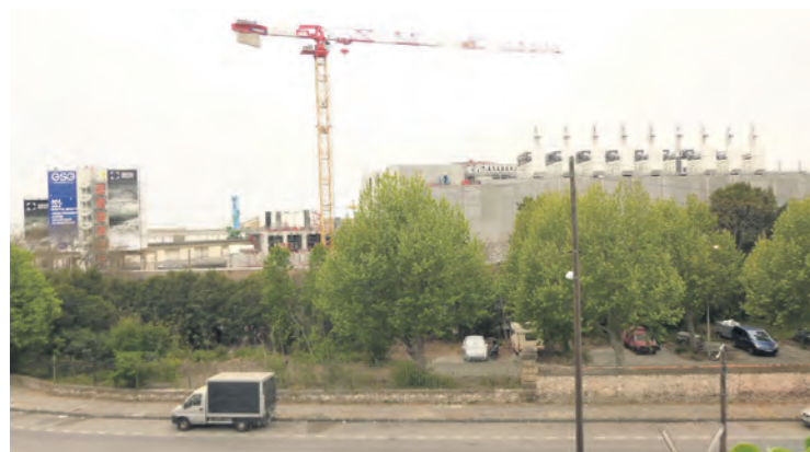
Sur le port de Marseille, le data center de Digital Realty en construction.

Pour sa défense, la direction du groupe précise qu'elle se serait pleinement conformée aux directives de la préfecture en remplaçant le fluide incriminé par un produit moins toxique... et pour faire bonne mesure, elle affirme qu'il n'est donc plus nécessaire de mettre