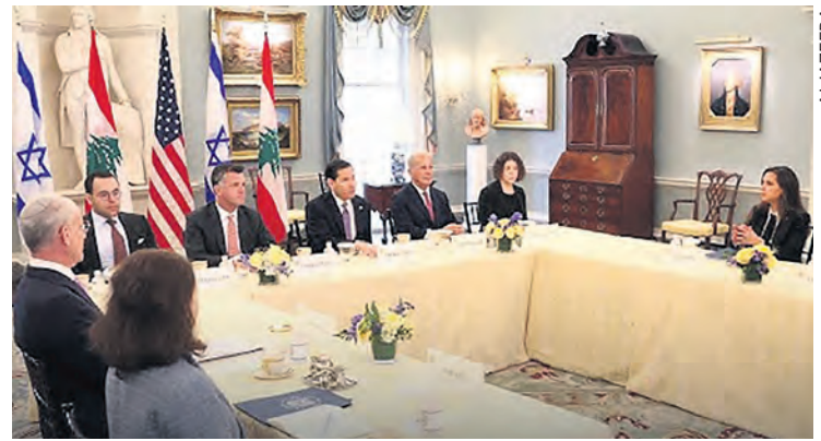
Le secrétaire d'État américain Marco Rubio avec l'ambassadrice du Liban et l'ambassadeur d'Israël aux États-Unis.

Sa guerre actuelle au Liban a déjà fait plus de 2 000 morts et un million de déplacés de force. Parmi ceux-ci, le Hezbollah trouvera des jeunes et des moins jeunes qui, la rage au cœur, ne rêvent que de venger leurs proches qui ont péri sous les bombes et tout ce qu'ils ont perdu.