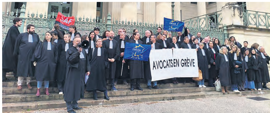
Devant la cour d'appel de Nîmes, lundi 13 avril.

En fait, le ministre est confronté au problème de l'engorgement des tribunaux. 6 000 dossiers sont en attente de jugement, faute de personnel pour les traiter ; il faut attendre en moyenne six ans pour une affaire de viol, et huit pour un meurtre. La France a déjà été condamnée par la Cour européenne des droits de l'homme à cause des délais de jugement indécents. Un précédent gouvernement avait créé en 2019 des cours criminelles départementales, généralisées à l'ensemble du pays en 2023, avec déjà pour objectif de décharger les tribunaux, mais