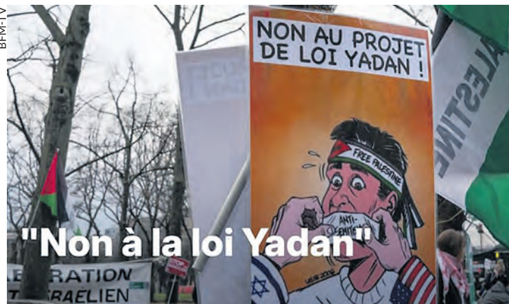
Manifestation contre le projet de loi Yadan.