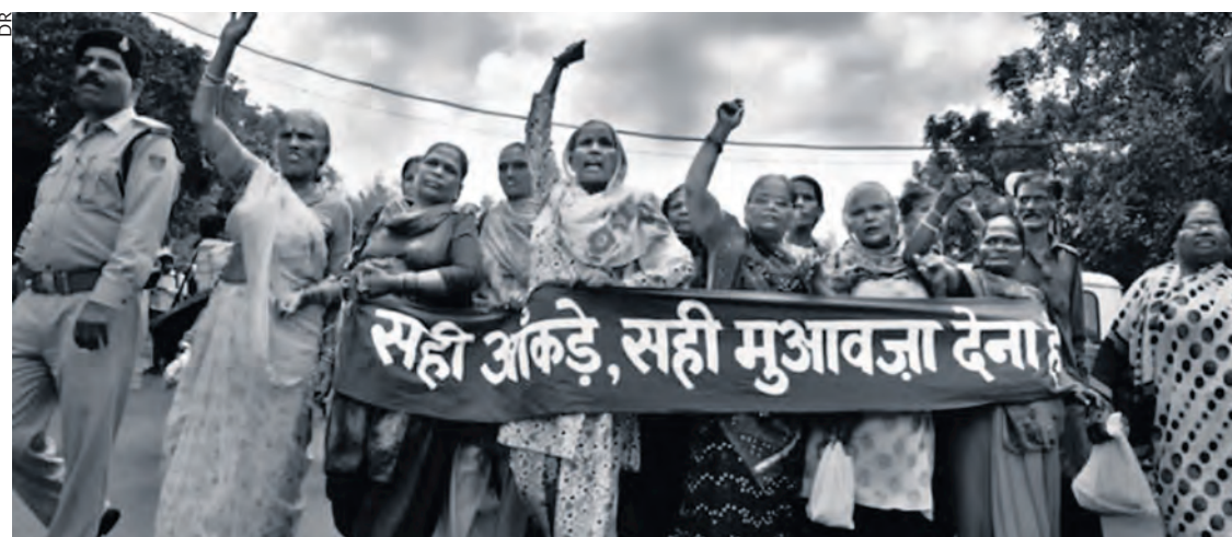
Des survivantes réclament justice en 2014.