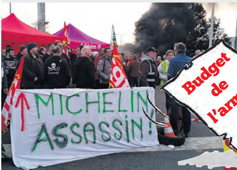
Michelin - Cholet