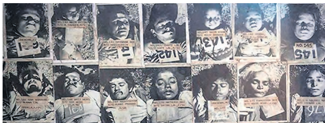
Quelques-unes des victimes.

Dès 1982, plusieurs accidents se produisirent, provoquant la mort d'un ouvrier, puis l'intoxication