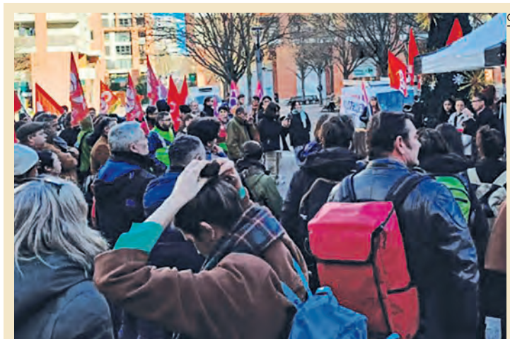
Rassemblement des bibliothécaires le 18 décembre, à Toulouse.