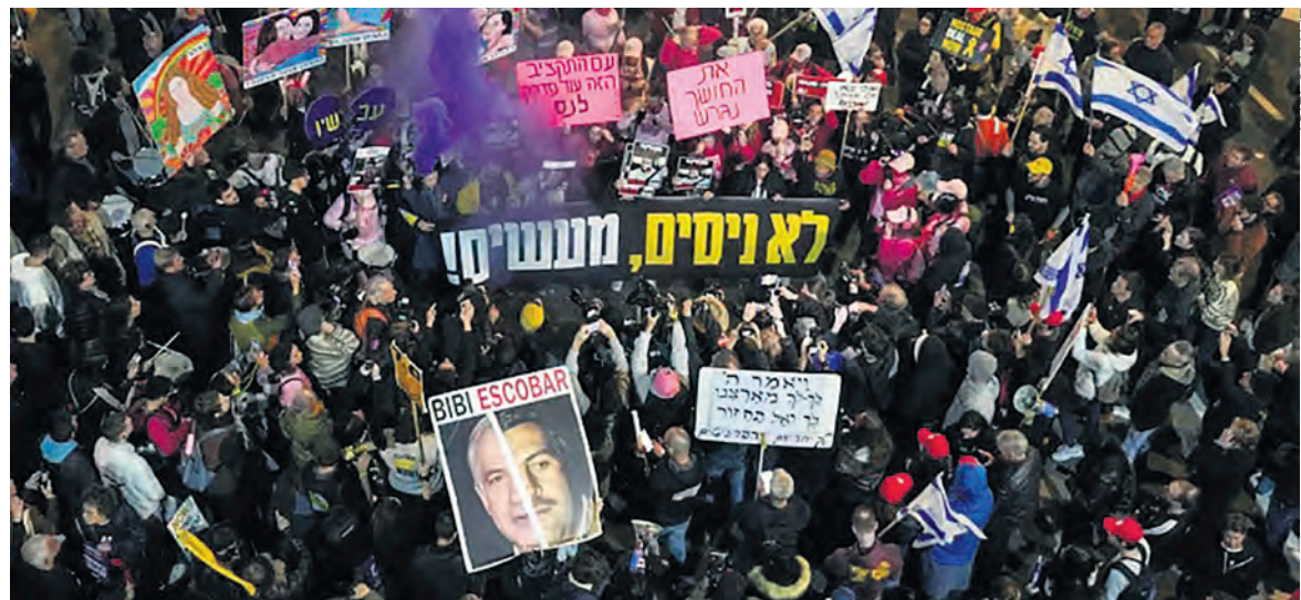
Tel Aviv, le 28 décembre : manifestation contre Netanyahu et pour la libération des otages.