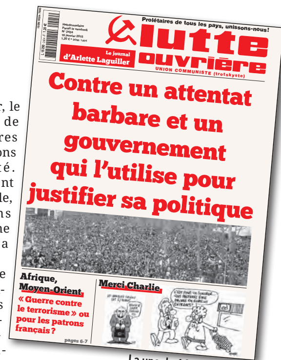
La une du 16 janvier 2015.

Au fil des années, ceux qui contestent la politique de l'État français sont de plus en plus souvent