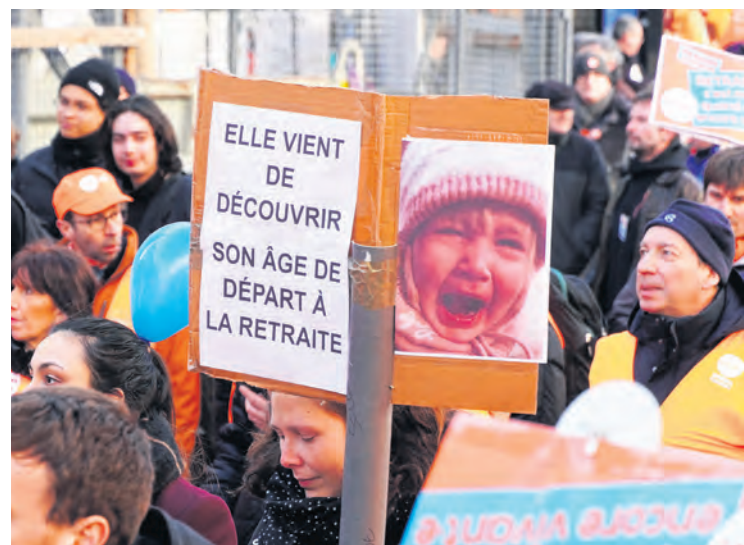
Manifestation contre la réforme des retraites en 2019.

Ainsi, le gouvernement s'est dit favorable à la réouverture du dossier des retraites, mais sans même envisager de suspendre cette réforme vomie par l'électorat populaire. Et comme pour chaque démolition des retraites, il a évoqué