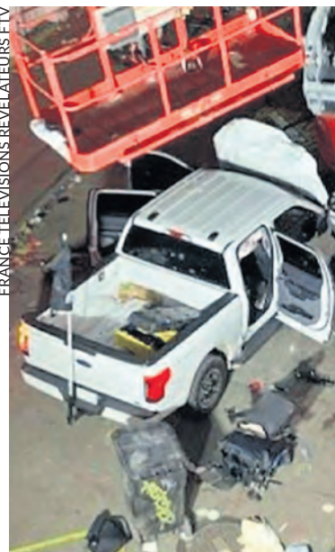
FRANCE TÉLÉVISIONS RÉVÉLATEURS ETV