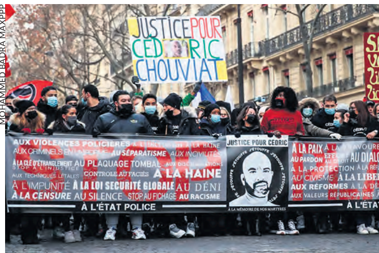
Manifestation pour Cédric Chouviat, en janvier 2021 à Paris.