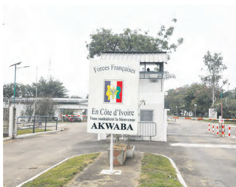
L'entrée du camp militaire français en Côte d'Ivoire à Port-Bouët, Abidjan.