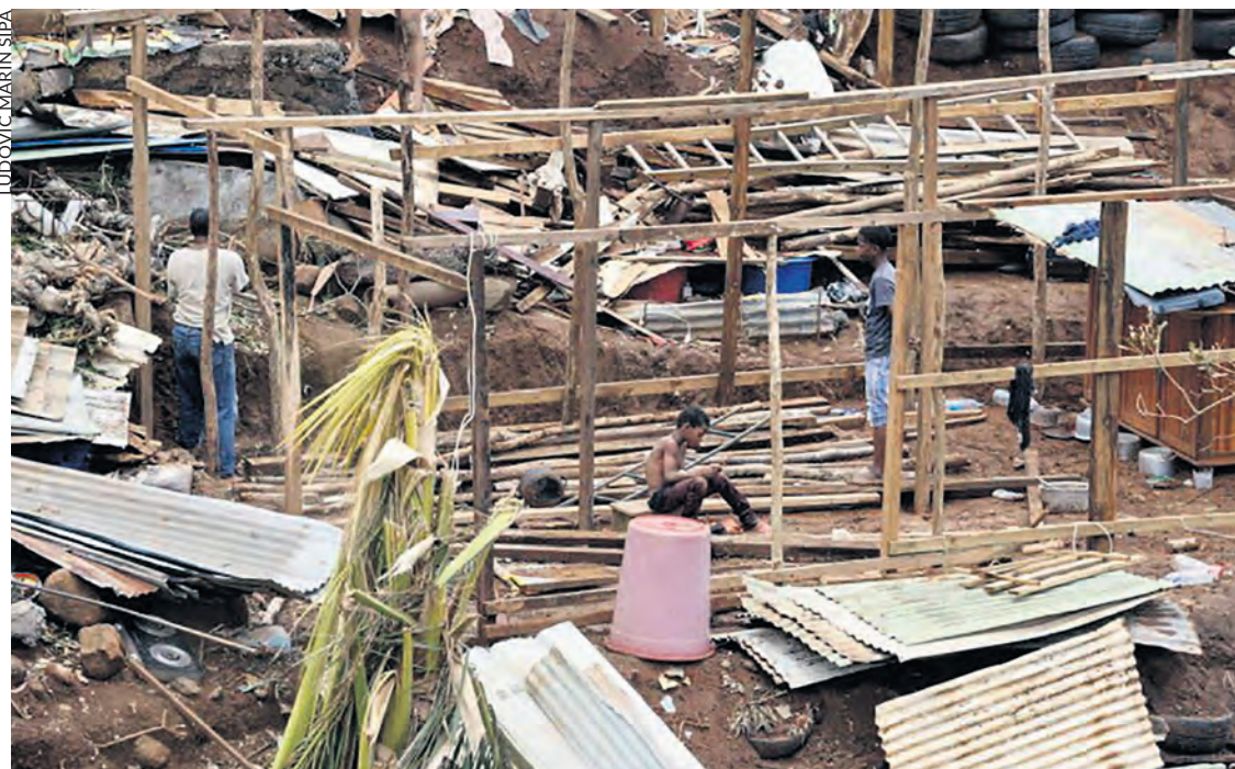
Les habitants reconstruisent leurs maisons.