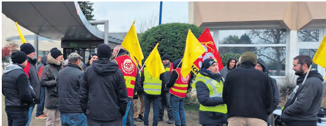
Rassemblement à Chambray le 7 janvier.

Ce jour-là et le lendemain, 8 janvier, seuls des simulacres de négociations ont eu lieu, comme lors du « premier round » le 12 décembre, que même les moins virulents des responsables syndicaux avaient trouvé « décevant ». La direction vient à ces rendez-vous avec un ordre du jour flou au possible, et surtout sans la moindre intention d’accéder aux revendications adoptées par les travailleurs lors de leurs assemblées générales, notamment une prime de