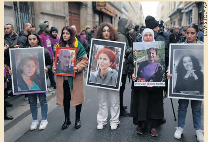
Marche silencieuse à Paris, le 26 décembre 2022, à la mémoire des militants kurdes assassinés.

Lutte ouvrière est solidaire de cette dénonciation et des manifestations organisées dont celle qui aura lieu à Paris samedi 11 janvier à 10 heures au départ de la Gare du Nord.