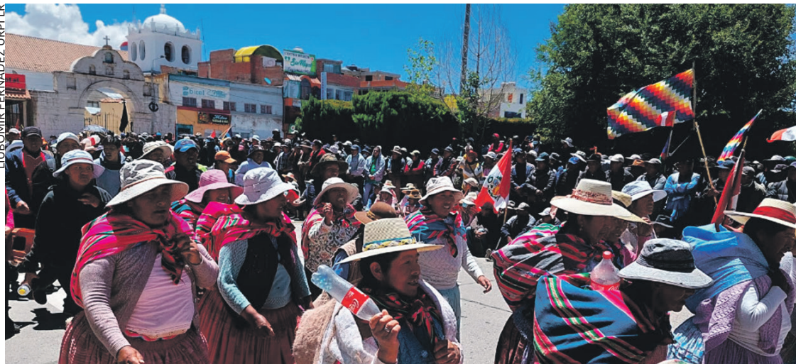
Des paysans aymaras marchent vers Lima pour exiger la démission de Dina Boluarte et la fermeture du Congrès.