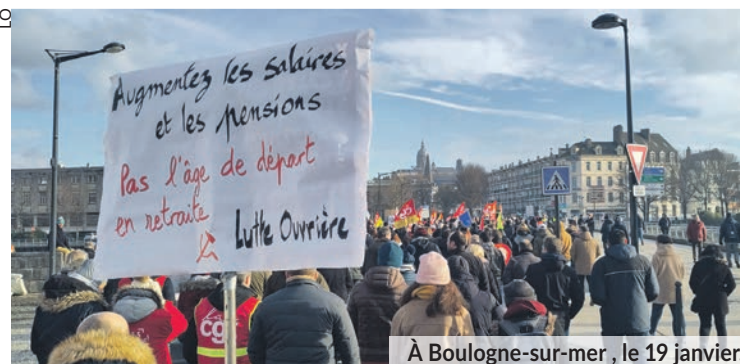
À Boulogne-sur-mer, le 19 janvier.