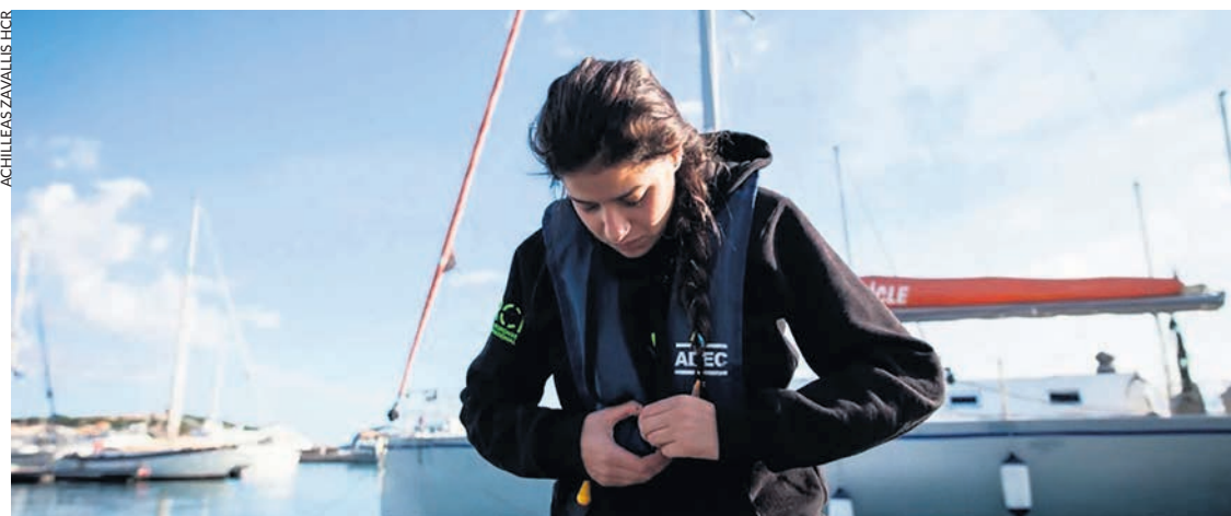
Sara Mardini s'équipe pour aider d'autres réfugiés, en 2016.