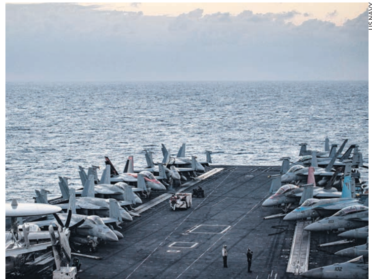
Le porte-avions USS Nimitz en mer de Chine du Sud le 12 janvier.

Les gouvernements occidentaux ont condamné les manœuvres conjointes des flottes chinoise et russe en mer de Chine début janvier. Comme ils dénoncent les incursions des avions chinois dans le ciel de Taïwan et les tirs réguliers, volontairement perdus en mer, de missiles venus de Corée du Nord. Le Japon fait évidemment partie du front antirusse et Kishida a réaffirmé son