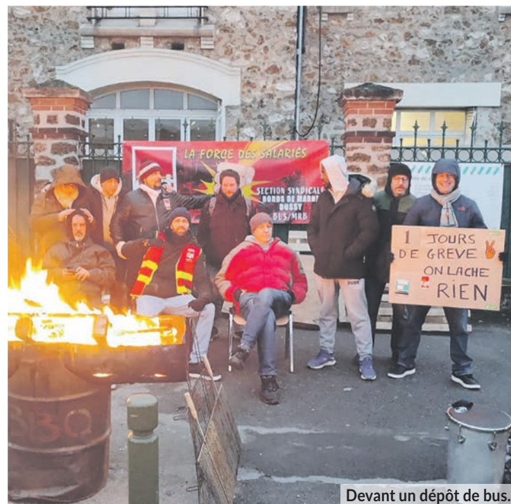
Devant un dépôt de bus.