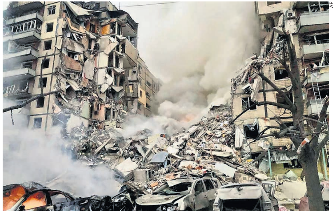
Dnipro après le bombardement.