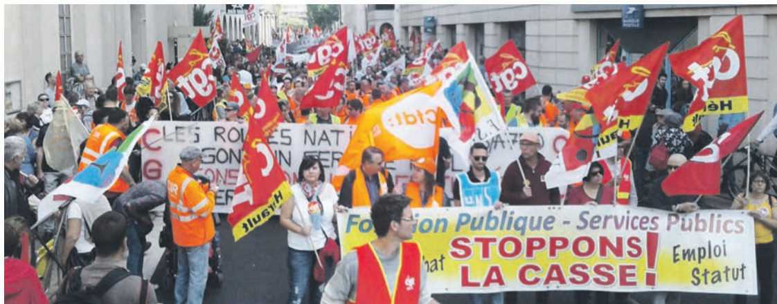
Montpellier, le 22 mai, les fonctionnaires dans la rue.

De plus, Macron veut encore augmenter la précarité, qui touche déjà plus d'un million de salariés