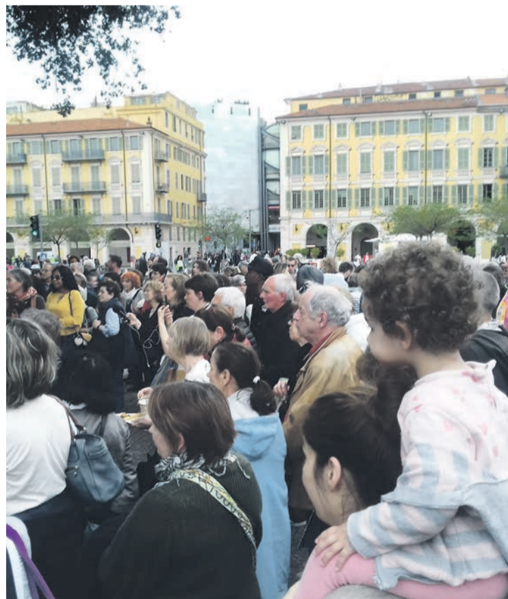
La marche des solidarités à Nice.