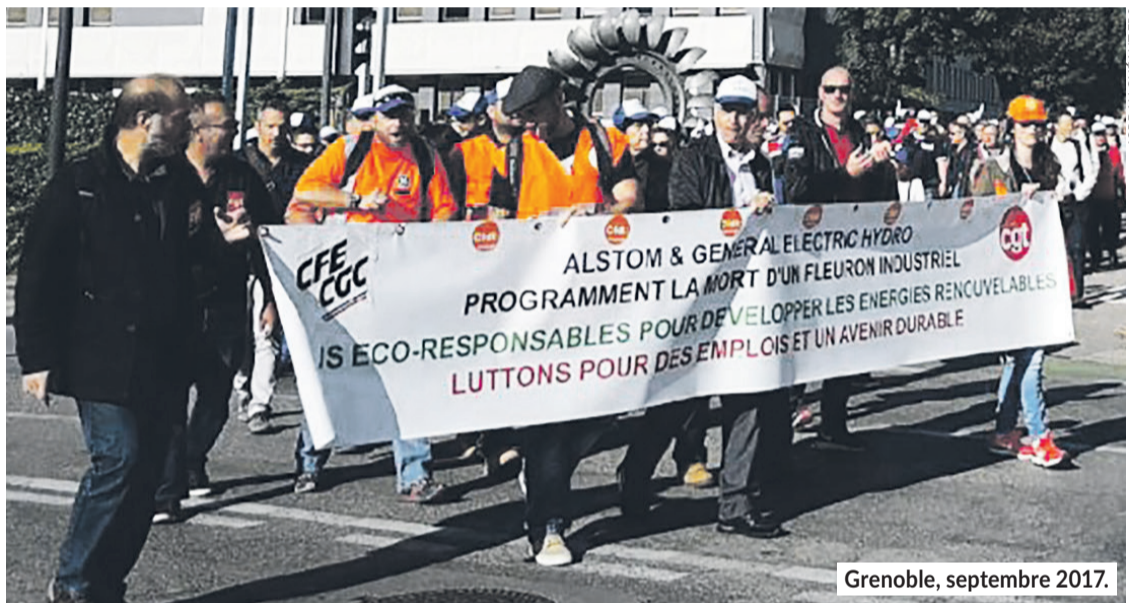
Grenoble, septembre 2017.