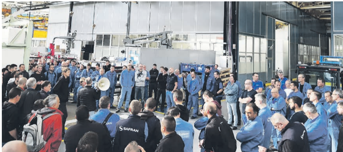
La grève à Safran Villaroche, le 14 juin.

La majorité des 800 salariés en équipe de l'usine Safran de Villaroche, en Seine-et-Marne, qui produit des moteurs d'avion, se sont mis en grève jeudi 14 juin et, pour une part, ont continué vendredi 15.