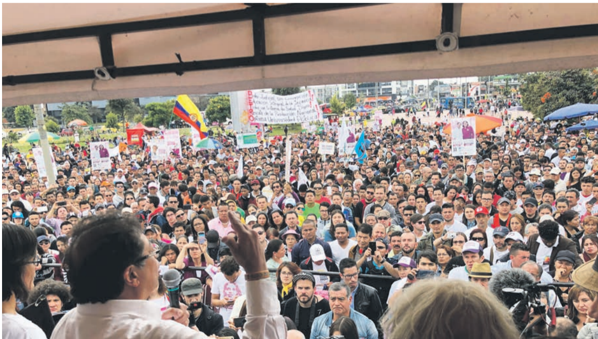
En février, Gustavo Petro en meeting.