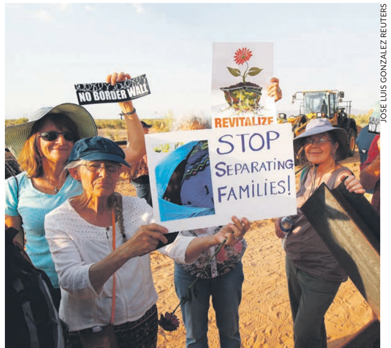
À la frontière mexicaine.