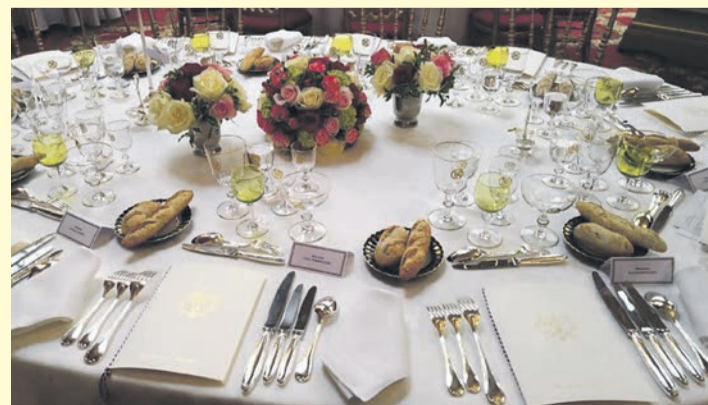
Déjeuner à l'Élysée en 2017 : c'est vrai que ça manque d'assiettes !