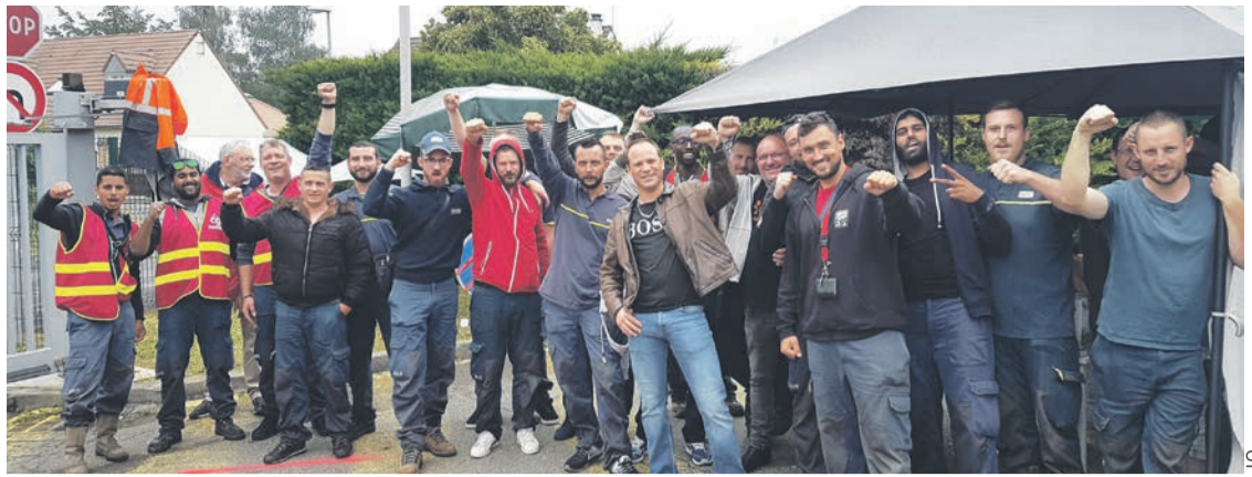
Les grévistes de Carrières-sous-Poissy.

différents endroits, comme récemment à Orthez, les cheminots se sont unis aux gaziers et électriciens. Un encouragement qui n'est sans doute pas pour rien dans l'extension du mouvement.