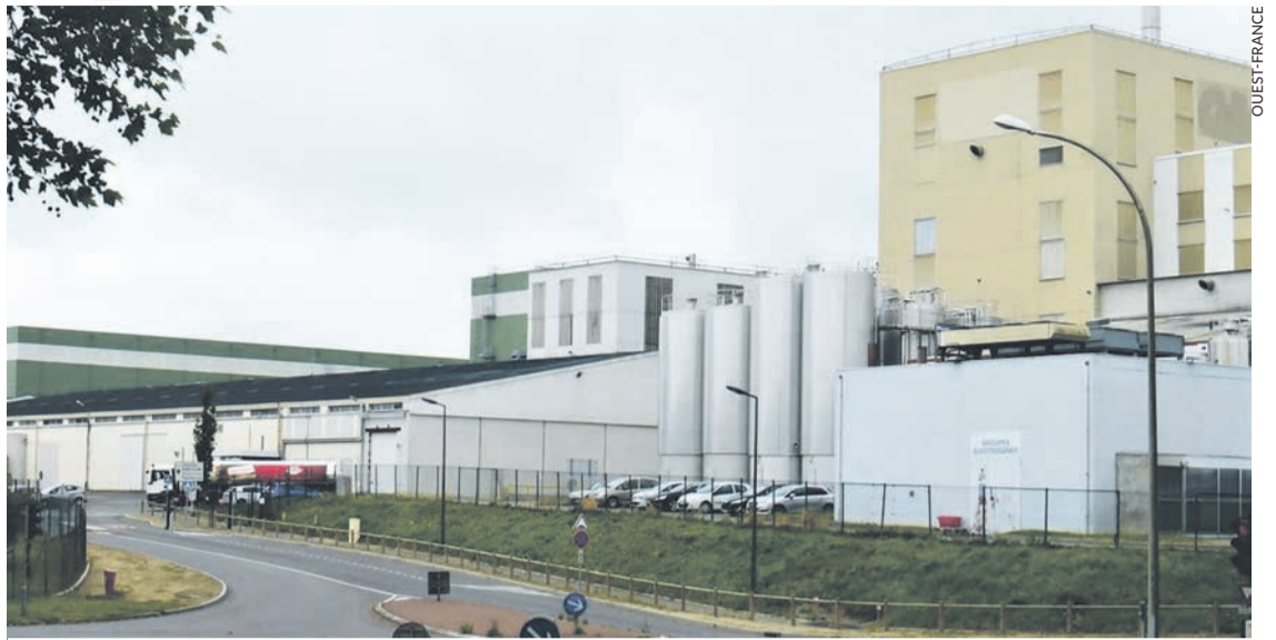
L'usine Lactalis de Craon.

s'indigner... ou de jouer à l'indignation. Ainsi Grégory Besson Moreau, membre de La République en marche et rapporteur de la commission, a conseillé au PDG de répondre précisément aux questions au lieu de lire ses notes. Puis il s'est interrogé pour savoir s'il ne faudrait pas «responsabiliser davantage certains dirigeants des industries agroalimentaires» par des «sanctions pénales et financières plus fortes». La main droite ignorant ce que fait la gauche, ce même député avait été félicité le 27 mai par le ministre de l'Agriculture pour avoir renoncé à introduire, dans la loi sur l'alimentation, une pénalité contre les patrons n'ayant pas vérifié, lors de la première mise sur le marché d'un produit, que celui-ci est conforme aux prescriptions en vigueur. En conséquence, cette obligation, pourtant pas énorme,