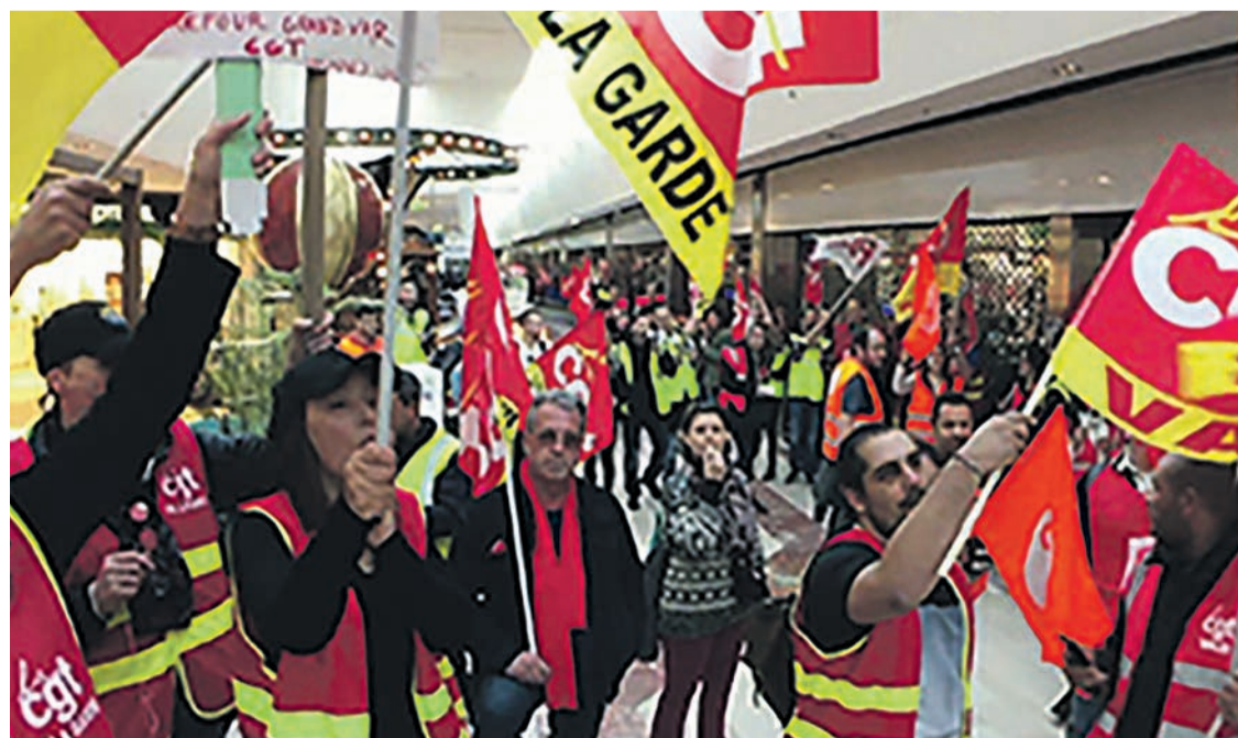
Grévistes de Carrefour Grand Var en mars 2018.