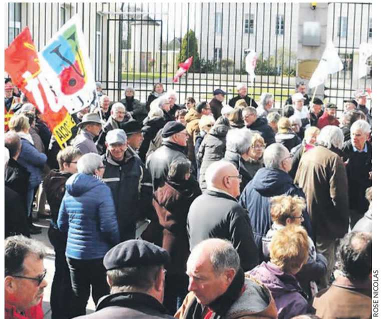
Le 15 mars à Alençon.