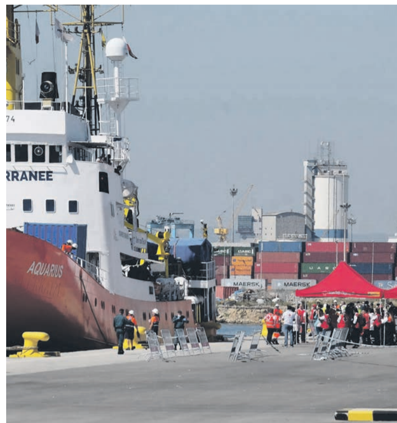
Arrivée de l' Aquarius à Valence, le 17 juin.