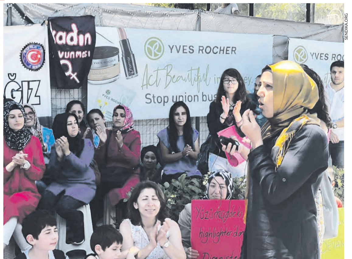
Le piquet des travailleuses licenciées, devant l'usine Flormar - Yves Rocher.

Cette lutte ayant eu des échos dans la presse, la direction du groupe a déclaré à propos de ces