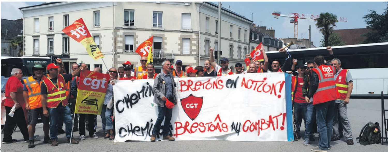
Cheminots à Pontivy.