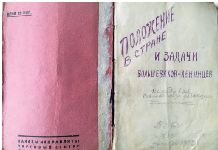
Brochure : « La situation dans le pays et les tâches des bolcheviks-léninistes ».

Alors que la classe ouvrière soviétique se trouvait sous la botte du stalinisme, qu'à l'étranger les partis sociaux-démocrates